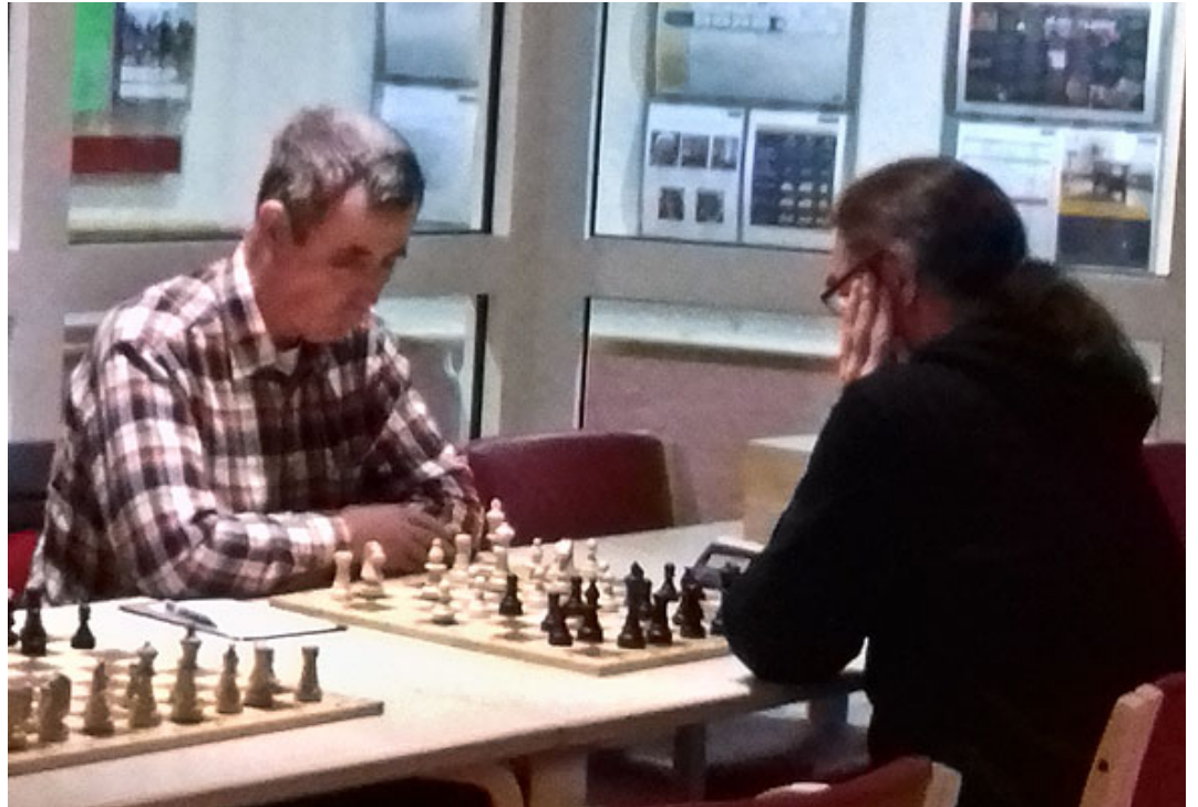
Dippel - Rohloff